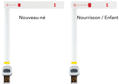
CAPTEURS RD SET™