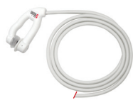
Capteur d'oreille E1®