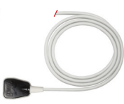
Capteur frontal TF-1®