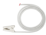
Capteur d'oreille TC-I