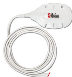
Capteur frontal TFA-1™