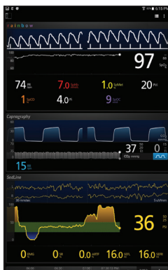
Configuration de l'écran supplémentaire Kite afin de présenter les données les plus pertinentes pour le patient ou le cas en cours

Grâce à la personnalisation de ce qui est affiché, Kite permet aux cliniciens de se concentrer sur les données les plus pertinentes à chaque étape des soins d'un patient, favorisant ainsi des prises de décisions en toute connaissance de cause